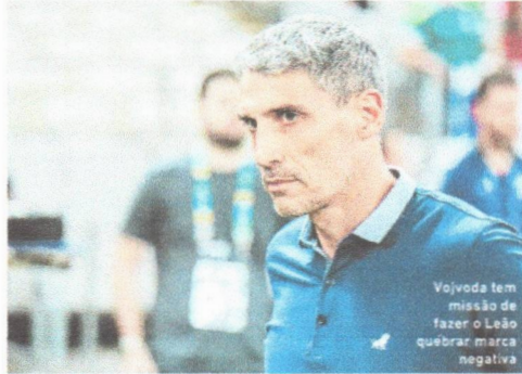
Wojvoda tem missão de fazer o Leão quebrar marca negativa

Brasil, que vão apresentar, em tese, adversários mais fortes para o Leão, o técnico Wojvoda precisa encontrar uma maneira da equipe superar situações que se iniciem de forma adversa. Frente aos bons resultados que o clube vem conquistando,